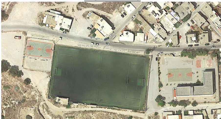
ΕΙΚΟΝΑ 1. ΓΗΠΕΔΟ

Ο ανάδοχος υποχρεούται να υλοποιήσει τα παρακάτω: