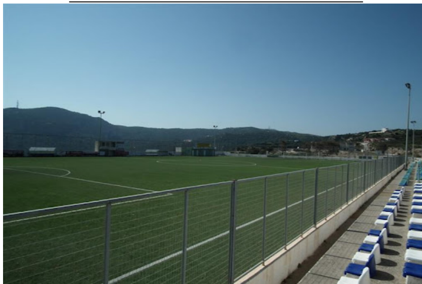
ΕΙΚΟΝΑ 1. ΓΗΠΕΔΟ ΑΘΛΗΤΙΚΗΣ ΕΓΚΑΤΑΣΤΑΣΗΣ